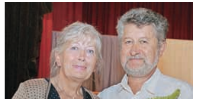
Dragica in Jožef Perne

je bil na občnem zboru izvoljen za predsednika društva. Pod njegovim vodstvom je v društvu zavel nov veter. Bil je pobudnik za združitev roketnih klubov Duplje in Trzič. Deloval je tudi na občinski ravni, saj je postal predsednik Komisije za šport Občine Naklo; njen predsednik je bil deset let, še vedno je član te komisije.