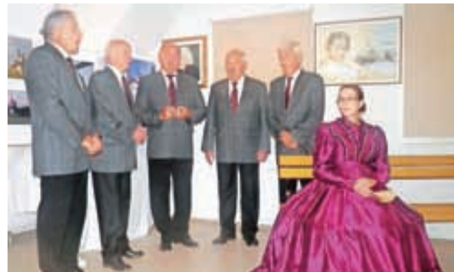
Bogat kulturni program je sooblikoval Kranjski kvintet.