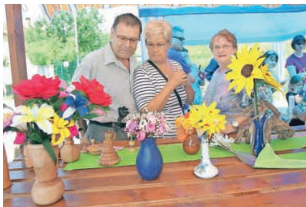
Članice in en član skupine Spominčice iz Naklega znajo klekljati, pred časom pa so osvojili tudi znanje izdelovanja cvetja iz krep papirja.