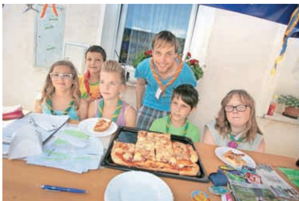
Taborniki Rodu Staneta Žagarja mlajši delujejo tudi v šoli v Dupljah in imajo dve skupini: Tabor neustrašljivih in Lene smrkce. Tokrat so pripravili Lov na lisico in Orientiring.