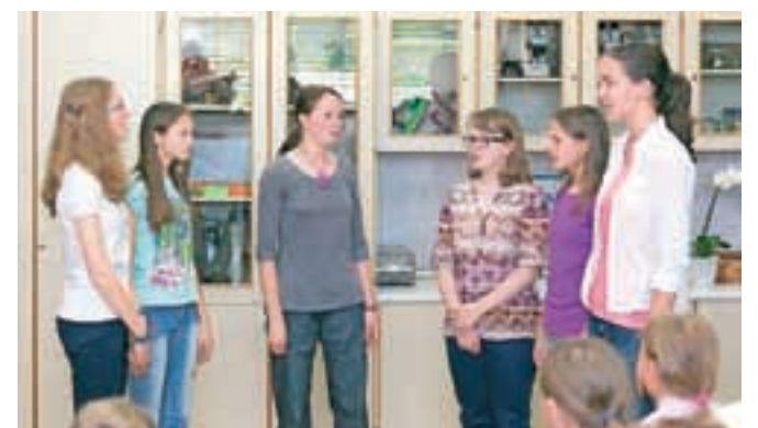
Ljudske pevke OFS Podkuca razveseljujejo z ubranim petjem na številnih prireditvah.