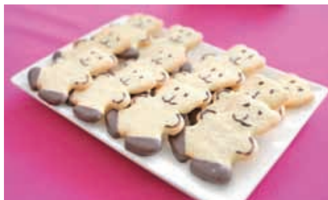
Ko ima človek poklic in zna opraviti neko delo, nastanejo tudi okusni piškoti.