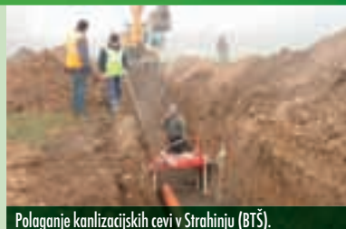
Polaganje kanalizacijskih cevi v Strahinju (BTŠ).

V prihodnjih mesecih bomo z deli seveda nadaljevali, zaradi česar bo še naprej prihajalo do zaprtij posameznih lokalnih cest, o čemer vas bomo redno obveščali. Ob tej priložnosti bi se vam želeli iskreno zahvaliti za doslej izkazano potrpežljivost, dobro sodelovanje in razumevanje. Prav zaradi vaše dobre volje nam uspeva projekt brez večjih pretresov peljati po zastavljeni poti.