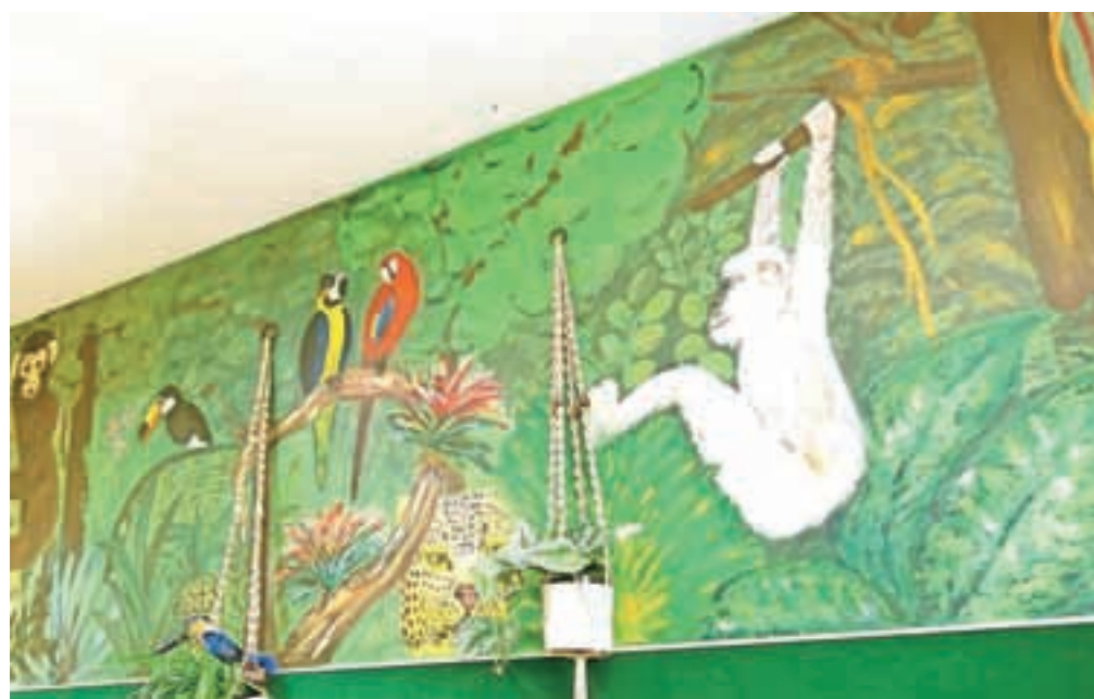
Izvirna stenska poslikava v biološki učilnici