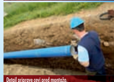
Detalji priprave cevi pred montažo.